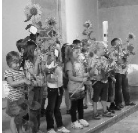
Verabschiedung der Sonnenblumen