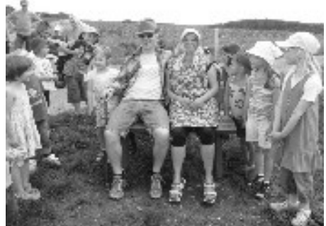
Familienausflug - Oma und Opa