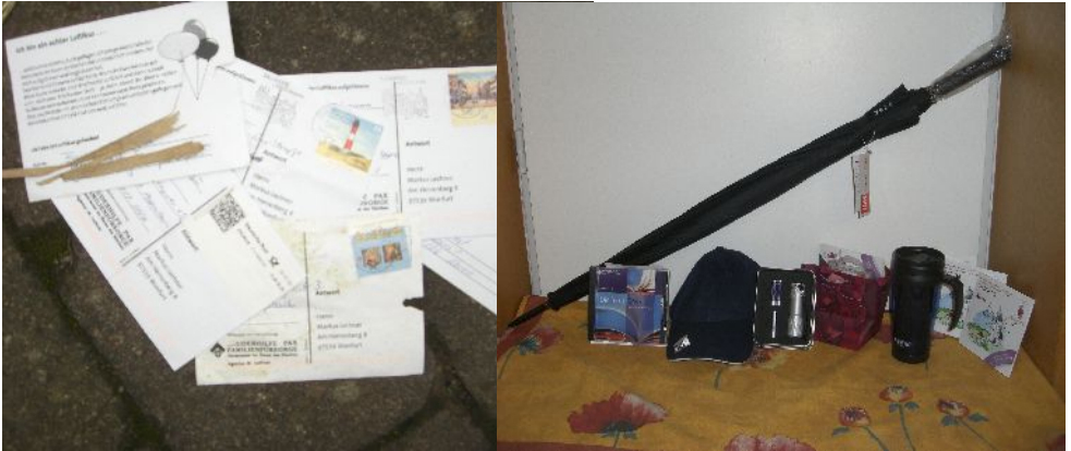
Die geflogenen und zurück gesendeten Karten (links) und die Gewinne, u.a. ein MP3-Spieler von der Bruderhilfe

Aufgrund ihrer kirchlichen Wurzeln fassen die BRUDERHILFE - PAX – FAMILIENFÜRSORGE ihre Verantwortung weiter. Bereits seit über 25 Jahren engagiert sich die von der BRUDERHILFE ins Leben gerufene Akademie mit Veranstaltungen, Publikationen und Aktionen in kirchlichen Arbeitsfeldern. Mit dem von den Versicherern im Raum der Kirchen gestifteten ökumenischen „Sozialpreis innovatio“ werden alle zwei Jahre zukunftsweisende Projekte zur Lösung sozialer Probleme in Deutschland ausgezeichnet.