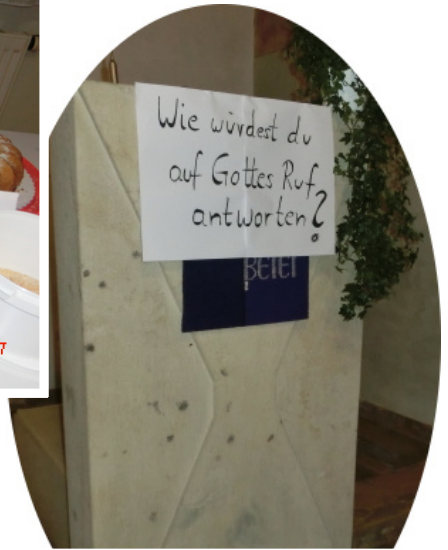
Ein Eindruck von der Kirche in Poppenlauer, und ein Ausschnitt vom Büffet anschließend im katholischen Gemeindezentrum.