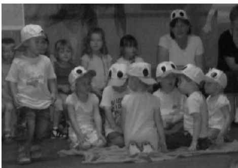
Die gelben Enten ...