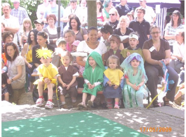
KiTa- Fest bei herrlichem Wetter, mit vielen Gästen und kurzweiligem Programm für alle.