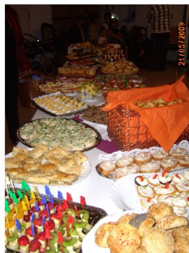
"Das leckere Buffet"