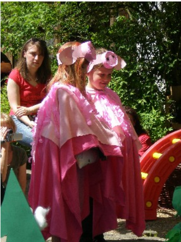
Aufführung der Kinder mit kunstvollen selbst gestalteten Kostümen.

Liebe Leser und Leserinnen, die letzten Wochen sind wie im Flug vergangen. Die nachstehenden Bilder sollen Ihnen einige Eindrücke unserer Aktionen vermitteln: