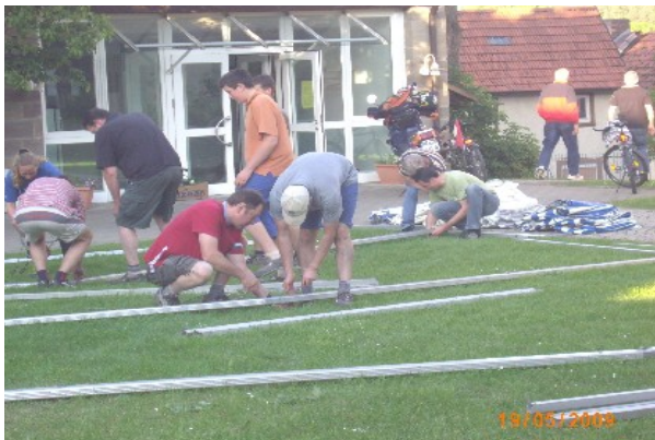
"Der Zelt Auf- Abbau"

Es war ein feucht-fröhlich- trauriges, gelungenes Abschiedsfest