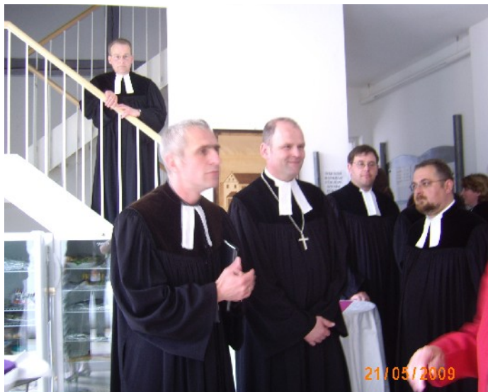
"Die vielen Pfarrer"

viele Menschen auf verschiedenste Weise eingebracht haben um das Fest mitzugestalten.