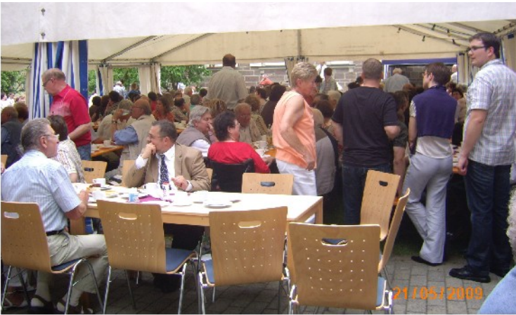
"Die vielen Gäste"