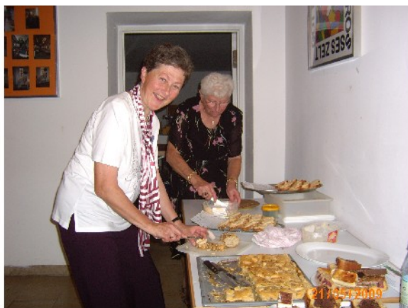
"Den vielen fleißigen Händen"