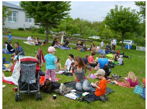
Wiesencafe zum Mutter- u. Vatertag mit 142 Gästen bei leckerem Kuchenbuffet