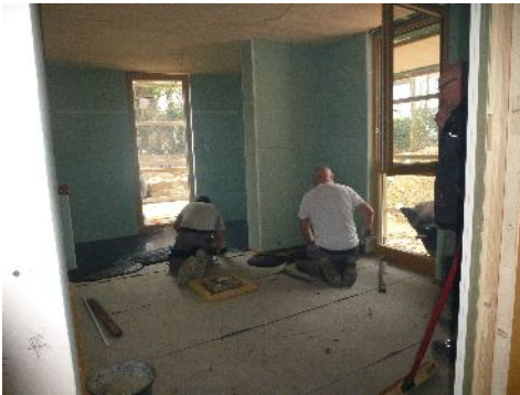
Im Neubau bei den Bodenarbeiten

Noch vor den Weihnachtsferien wurden die Fenster im Anbau eingesetzt und mittlerweile ist auch der Asphalttestrich aufgetragen.