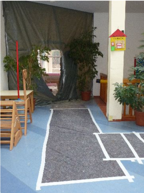
Leben mit einer Baustelle: Die Trennfolie am Übergang zwischen Alt und Neu