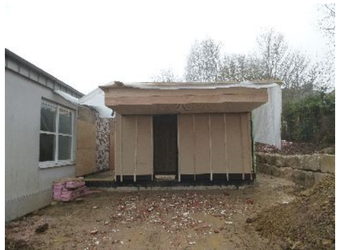
Hier entsteht der neue Eingang

Es geht zügig voran und wir nehmen weiterhin als möglichen Einweihungstermin Ende März in den Blick. Bitte beachten Sie dann unsere Einladung.