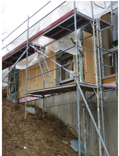
Der Neubau von der Seite

einem Schreiner gefertigter Einbau auch nicht teurer ist, als ein Spielgerät von einem Möbelhersteller.