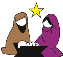
Grafik: Maren Aminit