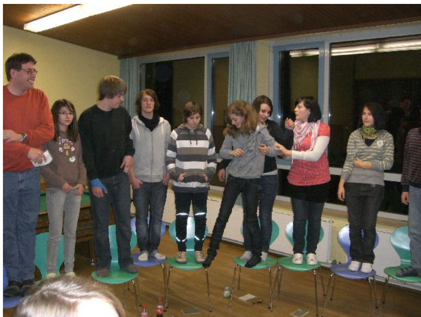
Kennenlernspiele beim gemeinsamen Konfi-Wochenende in Reichmannshausen