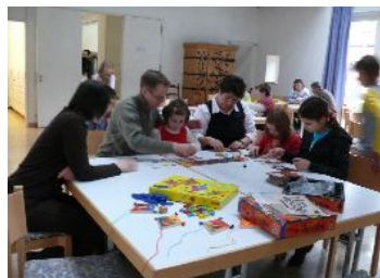
Minigottesdienst und Spielnachmittag am 9. November in Maßbach