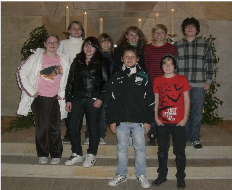
Die Präparandinnen und Präparanden aus Poppenlauer

Unsere Präparanden werden am 1. Advent in Maßbach und Poppenlauer vorgestellt.