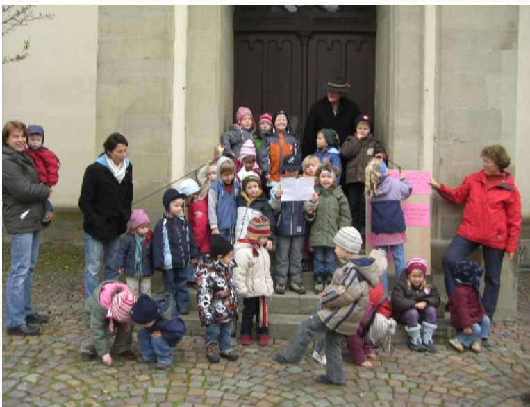
Die Kinder mit ihren Thesen vor der Kirchentür.

Fröhlich begannen die Kinder von Gottes Liebe in der Kirche zu singen. Da trat ein schwarzer Mann auf (B. Bieber), der den Kindern