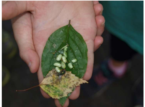
Foto in der Online- Ausgabe nicht ent- halten

Unten: Besuch in der Schule mit Schul- rallye